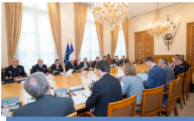
La Chaire ECODEF est membre du Conseil général de l'armement (CGARM)