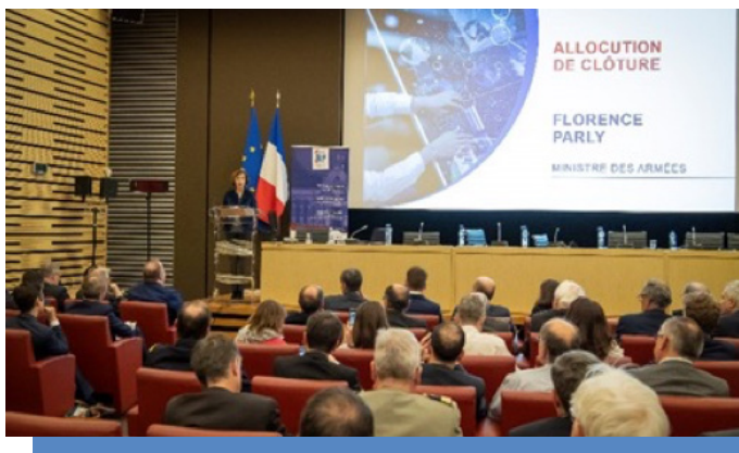
Allocution de Florence Parly, ministre des Armées, en clôture de la conférence ECODEF du 20 mars 2019 à l'Assemblée Nationale

Depuis sa création en janvier 2014, la Chaire produit des analyses qui sont utilisées comme références par les décideurs publics ou privés (ministère des Armées, ministère de l'Enseignement supérieur, de la Recherche et de l'Innovation, Parlement, entreprises...).