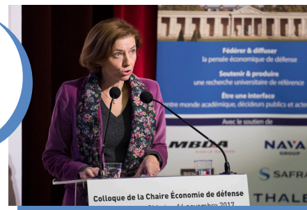
Allocution de Florence Parly, ministre des Armées, en clôture de la conférence ECODEF du 16 novembre 2017 à la Maison de la Chimie