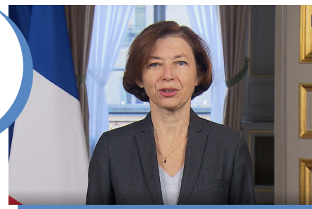
Allocution de Florence Parly, ministre des Armées, en clôture de la conférence ECODEF du 2 décembre 2020, à l'École militaire