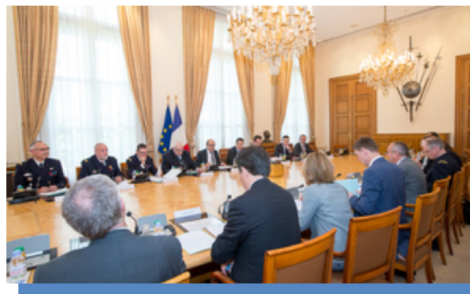
La Chaire ECODEF est membre du Conseil général de l'armement (CGARM)